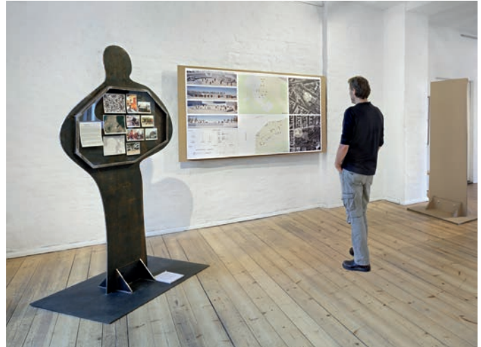
Stahl Figur, Außenraum Prototype und architektonische Installationspläne