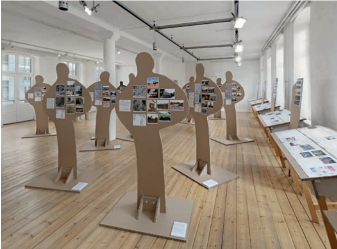
Dealer Silhouetten Rückseite und ausgewählte Artikel aus der Mediensammlung

Daneben steht eine weitere Figur, ähnlich wie die aus Wabenpappe, aber aus rostigem Stahl und die Fotos, Karten und der Text sind durch einen Vitrinen-Rahmen geschützt. An der Wand hinter der Stahlfigur hängen Architektur-Pläne und Ansichten vom Görlitzer-Park und vom Viktoria-Park in denen die mögliche Installation der insgesamt 13 Dealer-Figuren in diesen Berliner Parks dargestellt ist.