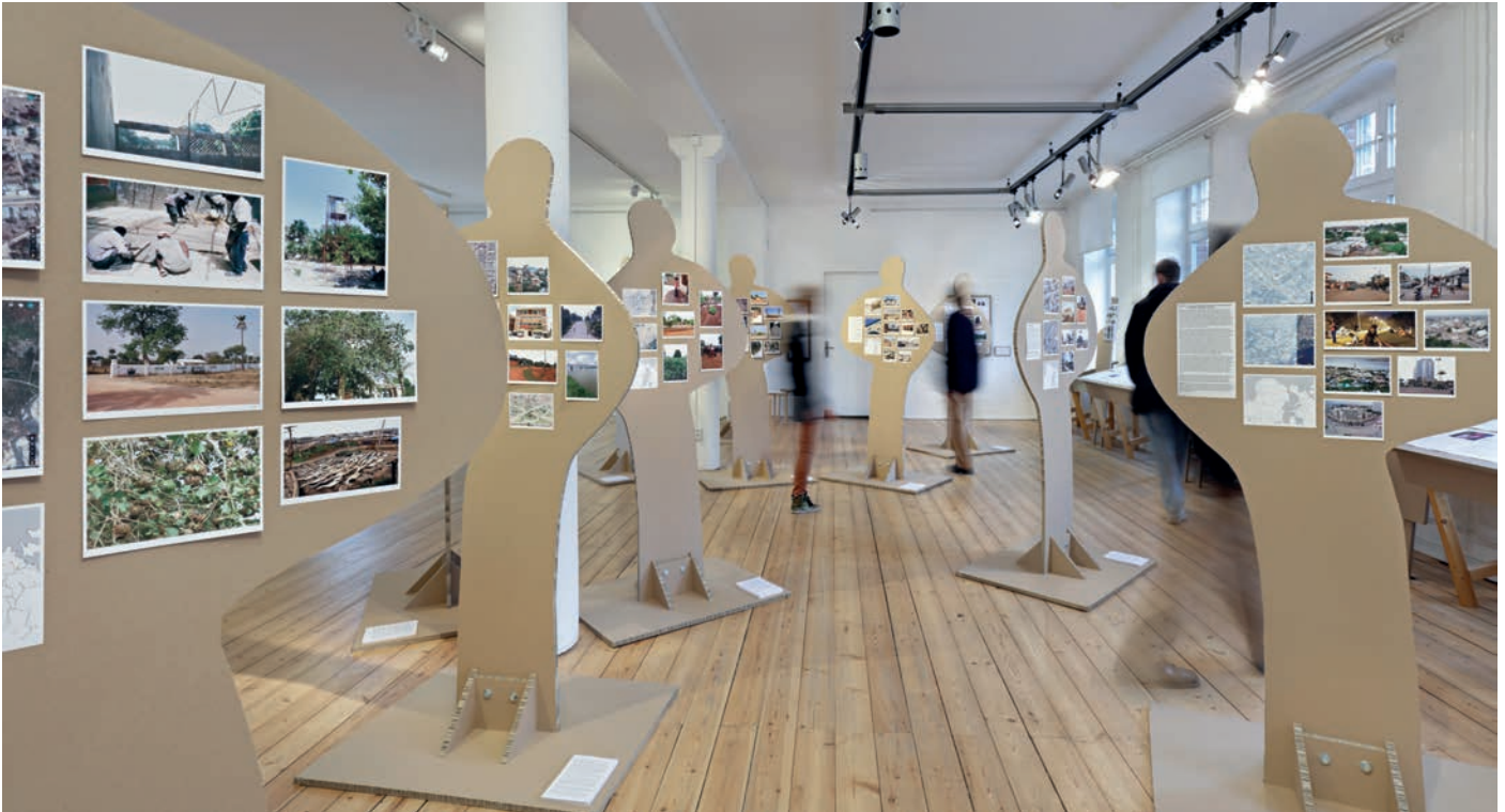
Dealer Ursprünge in Bildern und Muttersprache