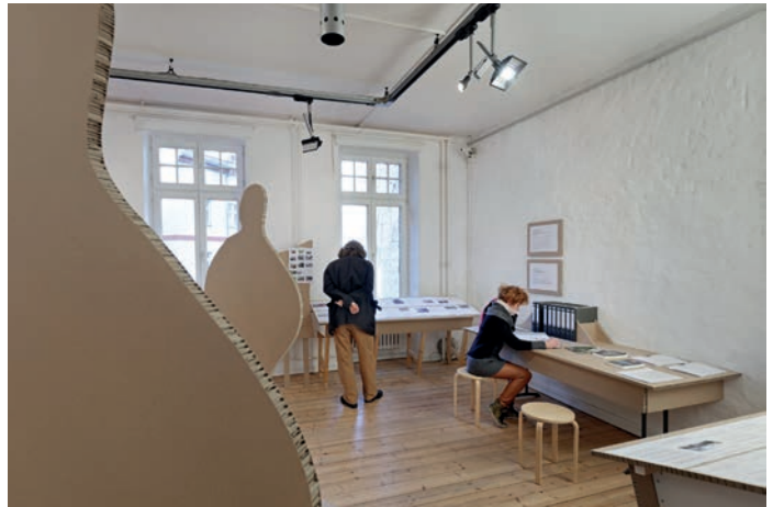
Mediensammlung über öffentlichen Drogenhandel